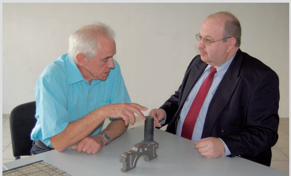
Die enge Zusammenarbeit mit den Durferrit-Fachkräften eröffnet den Härtereispezialisten Ferrotherm zusätzliche Marktchancen.